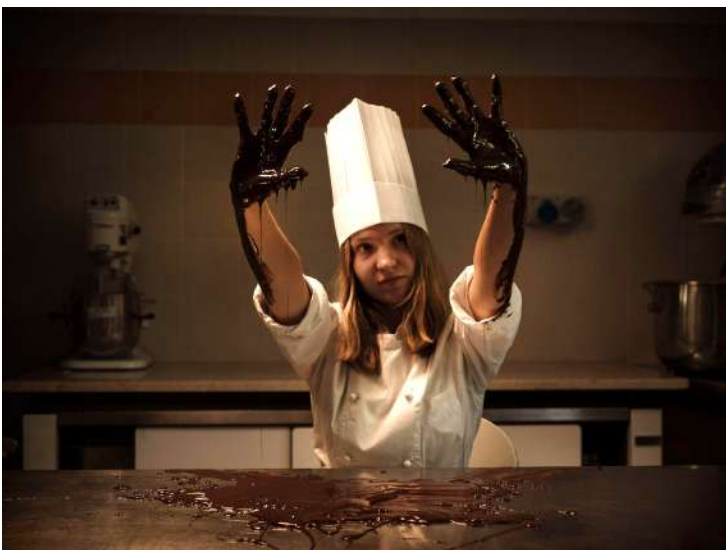
Σε αυτήν την φωτογραφία ο Chris De Bode εστιάζει στο πρόσωπο και τα χέρια της νεαρής μαγείρισσας, ενώ το φόντο είναι σκοτεινό και θολό.

Ως φωτογράφος, θα πρέπει να εξετάσετε προσεκτικά πόσο σημαντικές είναι οι λεπτομέρειες του παρασκηνίου για την ιστορία σας. Ένα μικρό βάθος πεδίου θα εστιάσει την προσοχή στο θέμα σας, ενώ το φόντο θα παρέχει μια γενική αίσθηση της ατμόσφαιρας ή της σκηνής. Αν θέλετε ο θεατής να παρατηρήσει σημαντικές λεπτομέρειες του φόντου, σκεφτείτε ένα μεγάλο βάθος πεδίου.