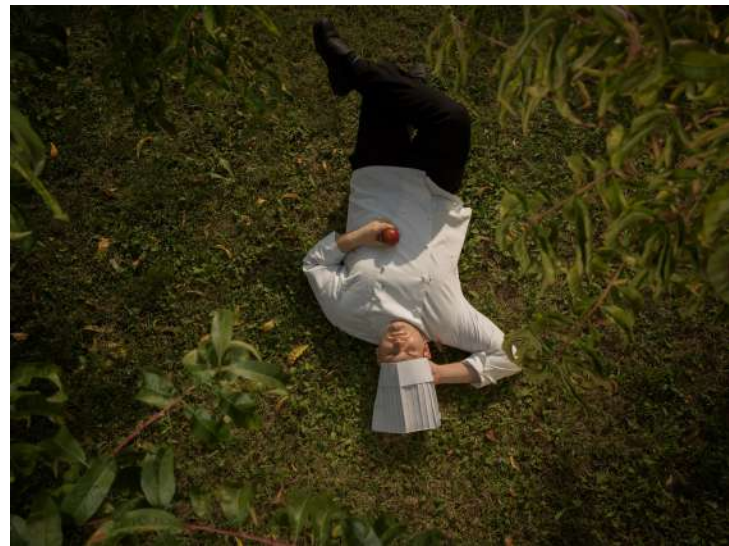
Ο Chris de Bode χρησιμοποιεί την οπτική γωνία ενός πουλιού