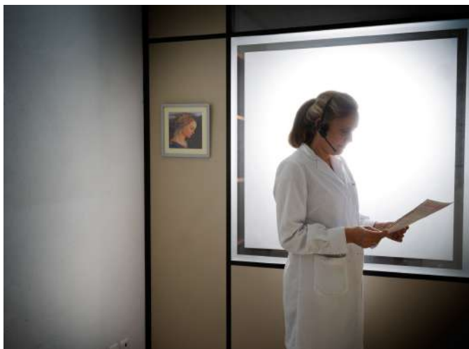
Μέσα από πλαίσια που βρίσκει στον χώρο ο Chris de Bode όχι μόνο προσθέτει χρήσιμες πληροφορίες σχετικά με το περιβάλλον της φωτογραφίας, αλλά κατευθύνει και την προσοχή του θεατή.

Η υπο-πλαισίωση είναι η χρήση ενός φυσικού πλαισίου μέσα στο κάδρο της φωτογραφίας - όπως μια πόρτα, ένα παράθυρο ή ένα στοιχείο του τοπίου - για να τονιστεί το θέμα.