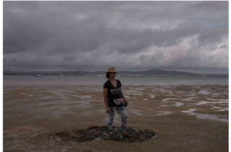
Εδώ βλέπουμε την γυναίκα στο ευρύτερο περιβάλλον της.